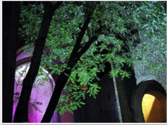
giochi di luce

Nell'ottocento lo Spasimo diventa sifilocomio, perciò nelle cronache del tempo indicato anche come "ospedale meretricio", e si avviano grandi trasformazioni del complesso.