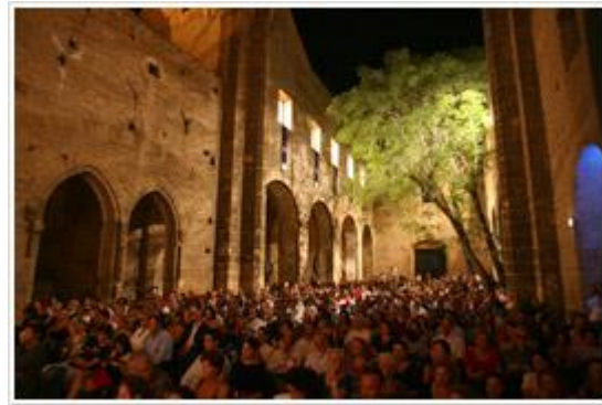
spettatori allo Spasimo

Il 25 luglio 1995 segna la data della riapertura al pubblico come suggestivo teatro all'aperto mentre dal 1997 i locali dell'ex-ospedale ospitano gli uffici della Fondazione The Brass Group, il Museo del Jazz, la Scuola Popolare di Musica, il Ridotto, denominato anche Blue Brass e la Scuola Europea d'Orchestra Jazz.