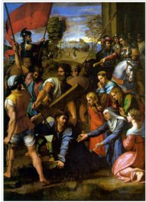
Lo Spasimo di Sicilia - Raffaello

E’ così che questo splendido complesso inizia la sua travagliata storia diventando prima teatro, poi lazzeretto nel '600 ed ancora magazzino per grano e cereali, rifugio per gli indigenti. E infine deposito di beni mobili e arredi casalinghi di genere non prezioso sequestrati dagli ufficiali giudiziari ai debitori insolventi.